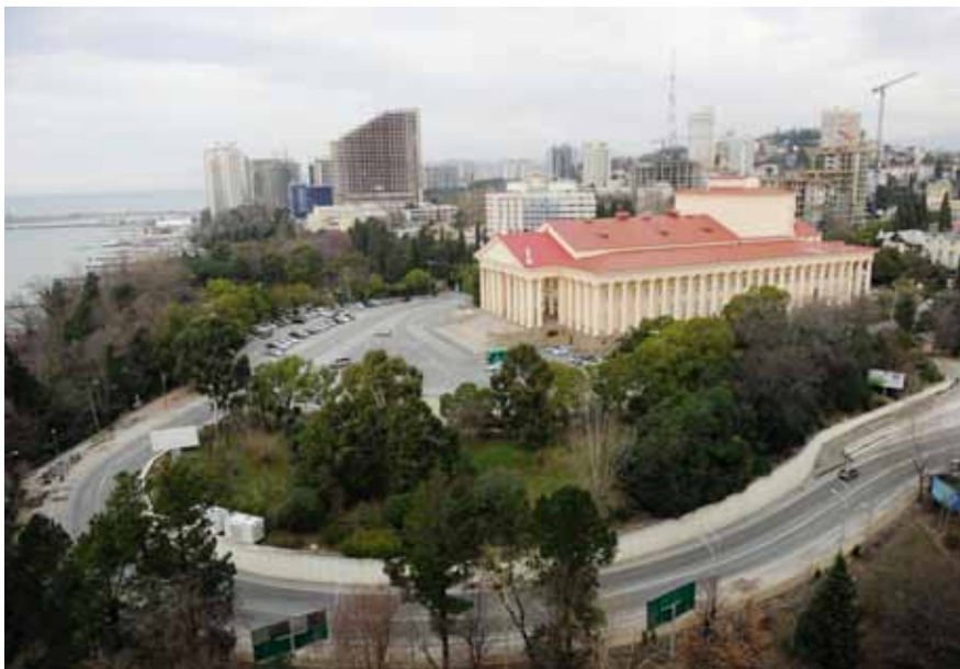
Sotschi: ein Jahr vor den Spielen

genannt. Ungefähr vier Millionen Urlauber besuchen jährlich den beliebtesten Urlaubsstrand von Russland. Aufgrund des milden Klimas gedeihen hier in wunderschönen Parklandschaften nicht nur subtropische Gewächse, sondern es werden auch Teepflanzen angebaut, wir finden hier die nördlichsten Teeplantagen der Welt. In der Umgebung von Sotschi sind auch viele Mineral- und Heilquellen entdeckt worden, die diese Stadt zum bekanntesten Kurort von Russland gemacht haben.“