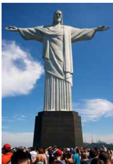
Christusstatue und Copacabana (rechts).